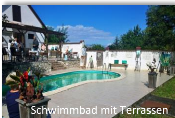
Schwimmbad mit Terrassen

Gegen halb eins wartet ein leckeres Mittagessen auf uns. Nach dem Genuss der Leckereien haben Sie Zeit für sich. Mach, was dir zum Beispiel am besten gefällt; mach einfach weiter mit dem was du gemacht hast, entspann dich auf einer Sonnenliege am Pool, lauf, lies. Kurz gesagt, nichts muss und vieles darf.