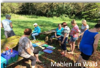
Mahlen im Wald

Gegen halb eins wartet ein leckeres Mittagessen auf uns. Nach dem Genuss der Leckereien haben Sie Zeit für sich. Mach, was dir zum Beispiel am besten gefällt; mach einfach weiter mit dem was du gemacht hast, entspann dich auf einer Sonnenliege am Pool, lauf, lies. Kurz gesagt, nichts muss und vieles darf.